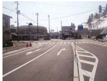
堀之内・小出線街路工