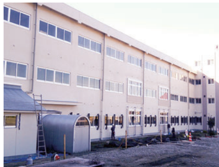
湯之谷中学校校舎改修（第1期）